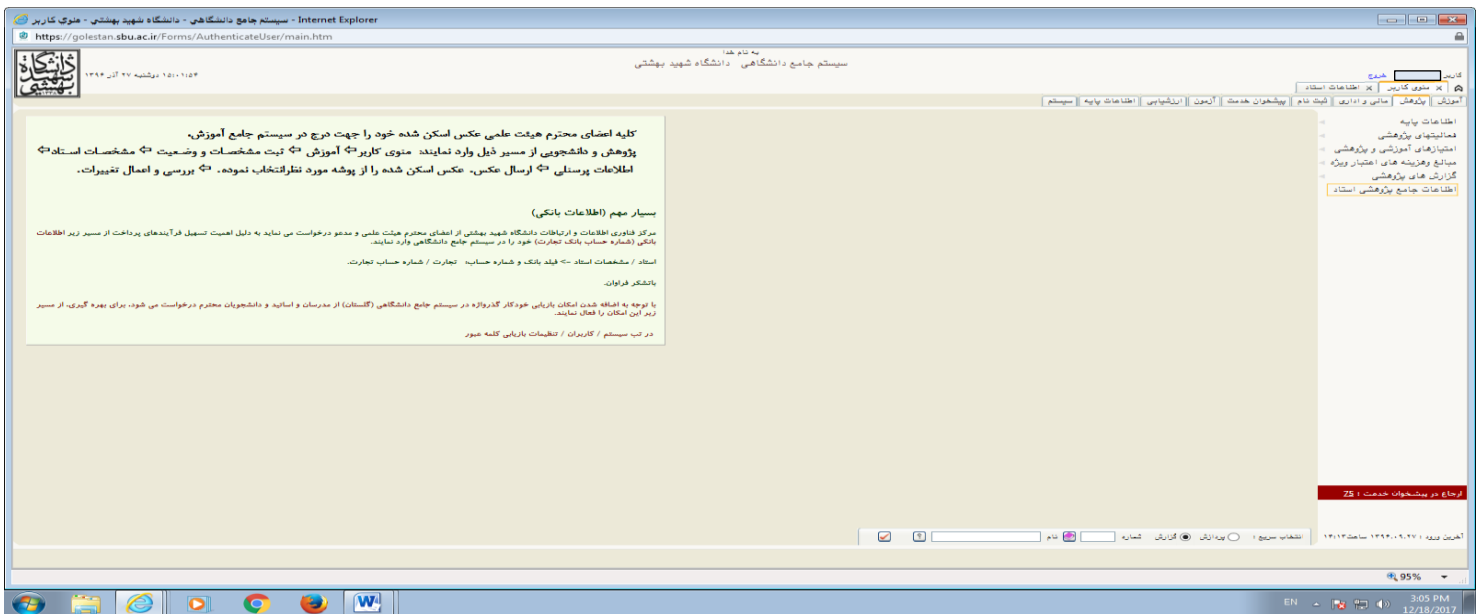
تصویر شماره (۲)

پاسخ: صفحه اصلی کاربر ← پژوهش ← اطلاعات جامع پژوهشی ← جستجو (تصویر شماره ۲)