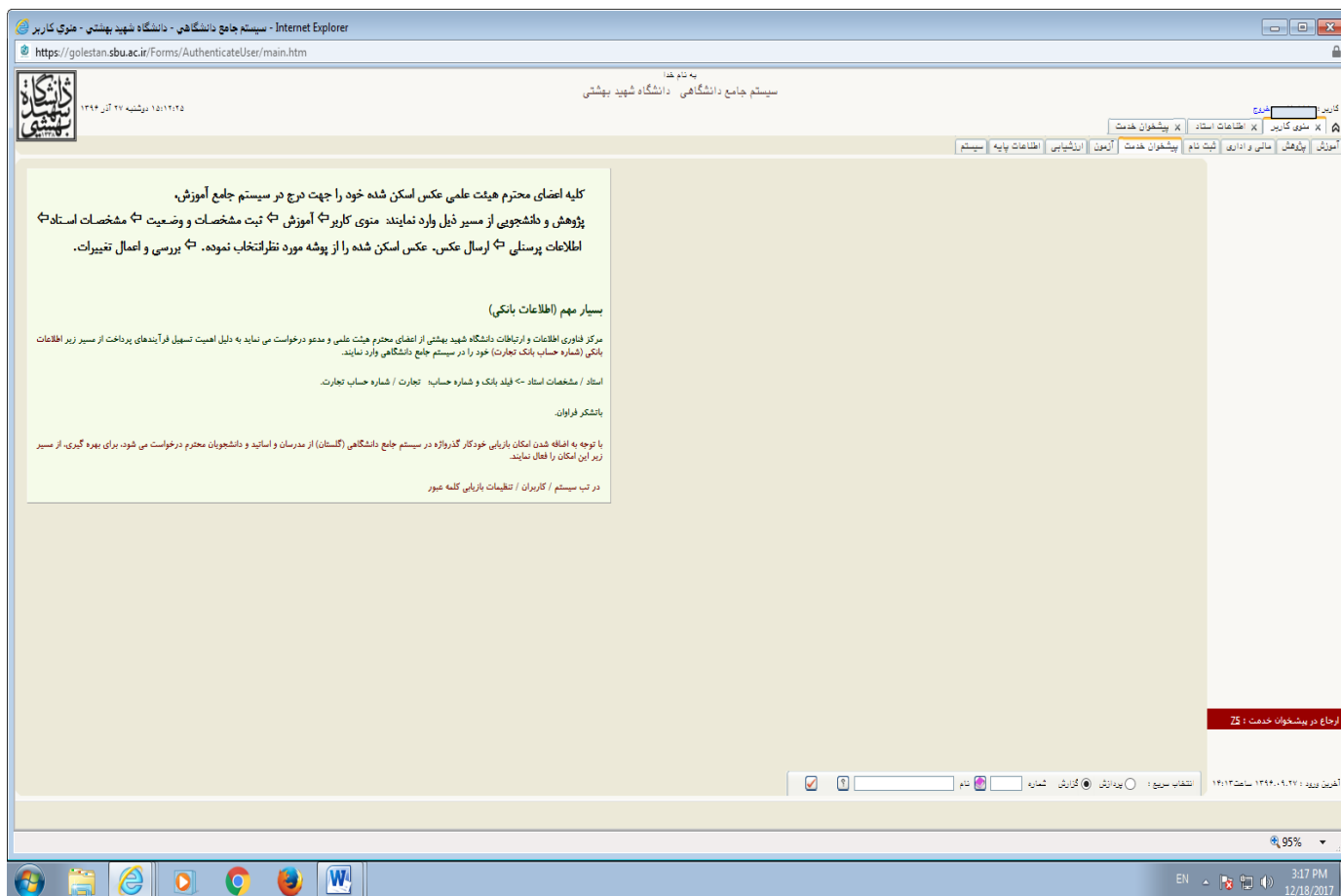
تصویر شماره (۳)

هریک از موارد ذیل در پیشخوان خدمت سامانه گلستان انتخاب و انجام شود